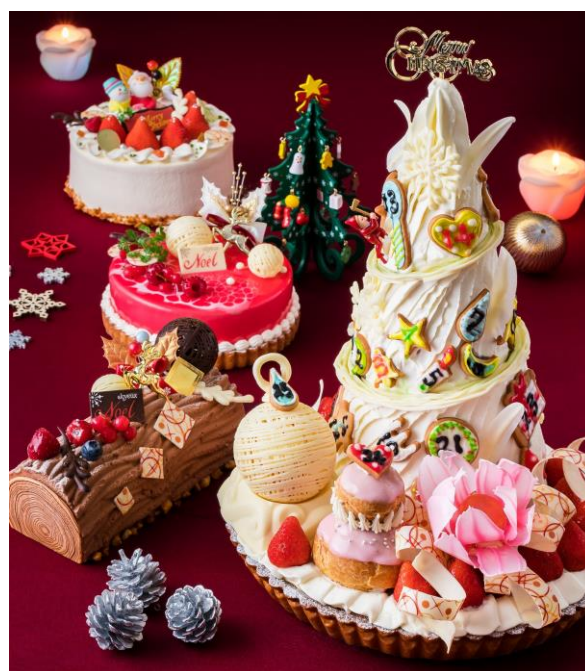
『三田ホテル』2017年手作りクリスマスケーキ

クリスマスにはご家族、ご友人と『三田ホテル』の手作りケーキを囲んで楽しくお過ごしください。