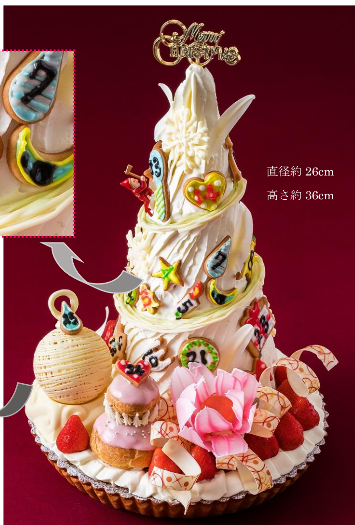
直径約 26cm 高さ約 36cm