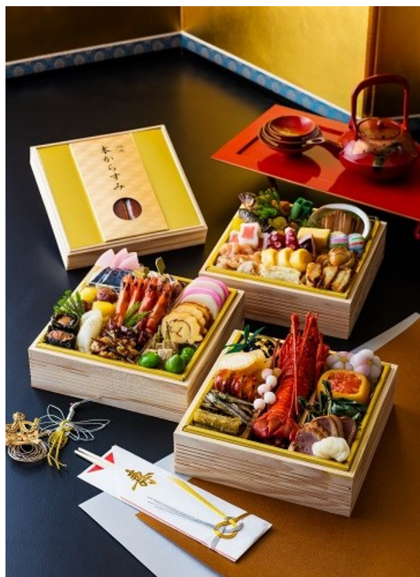
三田春帆楼「和三段おせち」(本からすみ付) 39,800円(税込み)

お正月は、ご家族、ご友人とともに、ホテルの料理長がこだわった食材のおせちをお楽しみください。